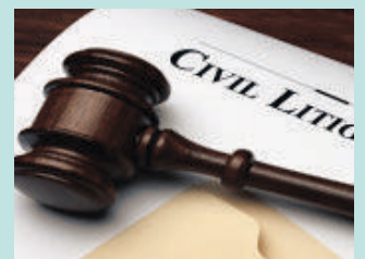
민사 소송 Civil Litigation