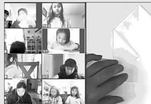
▲ 지난 상반기에 온라인으로 운영된 종이접기반 수업 모습.

LA한국교육원이 2021년 하반기 뿌리교육 강좌를 개설, 운영한다. 개설 강좌 및 개설 기간은 한국어(8월 30일~12월 8일, 수준별), 한자 & 민화, 코딩, 종이접기, 서예, 태권도, 전통공예, K-POP문화, 난타, 민화 & 공예, 해금(이상 8월 28일~12월 11일) 등이다.