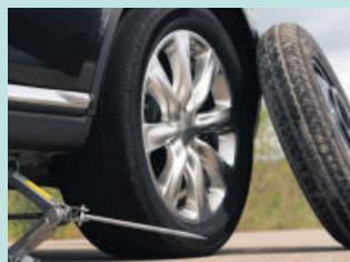
타이어 결함 Defective Tires