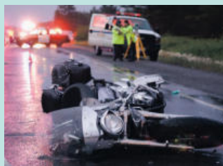
오토바이 사고 Motorcycle Accidents