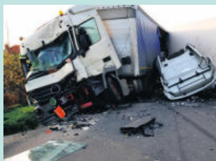
트럭 사고 Truck Accidents