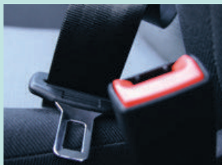
안전벨트 결함 Defective Seatbelts