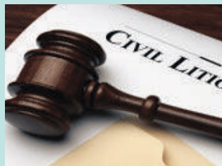
민사 소송 Civil Litigation