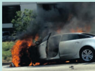
차량 화재 Car Fires