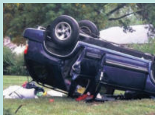
지붕파손 / 차량전복 Roof Crush / Roll Overs