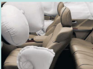
에어백 결함 Defective Airbags