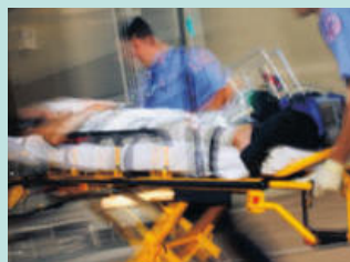
심각한 부상 Serious Injuries