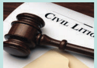
민사 소송 Civil Litigation