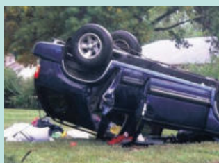
지붕파손 / 차량전복 Roof Crush / Roll Overs