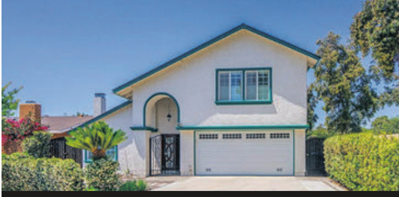
싸이프레스 단독 주택 978천

방 3개 화 2.5개 1721 sqft 2015년 보시면 바로 사랑에 빠지실 매물입니다. 넓은 거실. 넉넉한 수납공간의 부엌, 부에나 팍 유명 소스몰 건너편 새 파이프, 새 워터히터, 새 에어컨