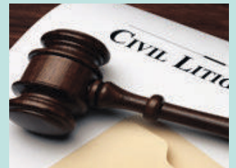
민사 소송 Civil Litigation