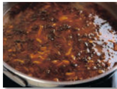
4. 양념한 시래기와 물을 부어 고루 섞고, 끓기 시작하면 중약불로 줄여 뭉근하게 20분간 끓인다.