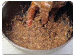
3. 또 다른 볼에 콩치통조림의 콩치를 국물까지 모두 함께 붓고 주물러 곱게 다진다.