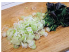
6. 끓는 동안 대파와 청양고추는 송송 썰고, 깻잎도 4-5등분하여 준비한다.