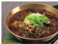
8. 먹기 직전 취향껏 후춧가루와 산초가루를 뿌려서 드시면 끝.