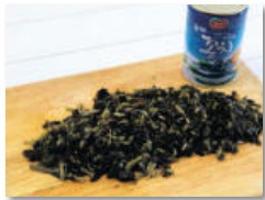
1. 삶은 시래기를 2-3cm길기로 송송 썰고, 콩치통조림 1통도 함께 준비한다.

◆ 주재료: 콩치캔(큰 것 1캔-400g), 삶은시래기(3줌-300g), 대파(1대), 청양고추(3개), 깻잎(10장), 물(12컵), 소금(적당량) ◆ 시래기양념재료: 고춧가루(3), 다진 마늘(2), 다진 생강(0.3), 된장(3), 참치진국(3) ◆ 추가재료: 후춧가루, 산초가루(적당량)