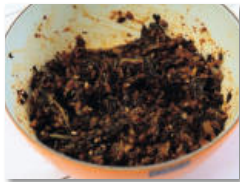
2. 시래기를 볼에 담고, 시래기 양념재료를 넣고 조물락조물락 골고루 양념을 한다.