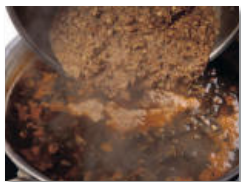
5. 콩치통조림 곱게 다진 것을 모두 넣고 중약불에서 15-20분간 더 끓인다.