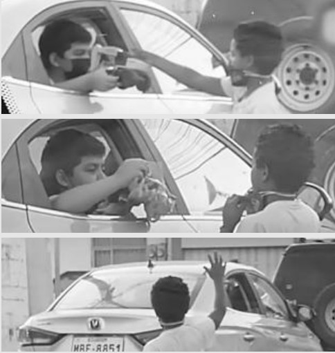
▲ 사진=유튜브(저플릭스) 캡처

멕시코의 길에서 포착된 연출 없는 한 편의 드라마 처럼 사회에 감동을 주고 있다.