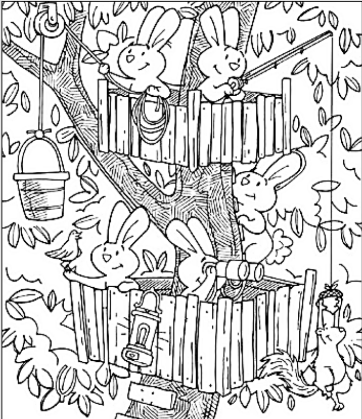
© 위의 그림에 숨어있는 아래 그림을 찾으며 영어 단어도 익혀 보세요. (해답은 P45에 있습니다.)