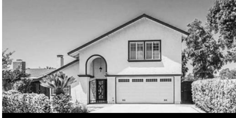
싸이프레스 단독 주택 978천

방 3개 화 2.5개 1721 sqft 2015년 보시면 바로 사랑에 빠지실 매물입니다. 넓은 거실. 넉넉한 수납공간의 부엌. 부에나 유명 소스몰 건너편