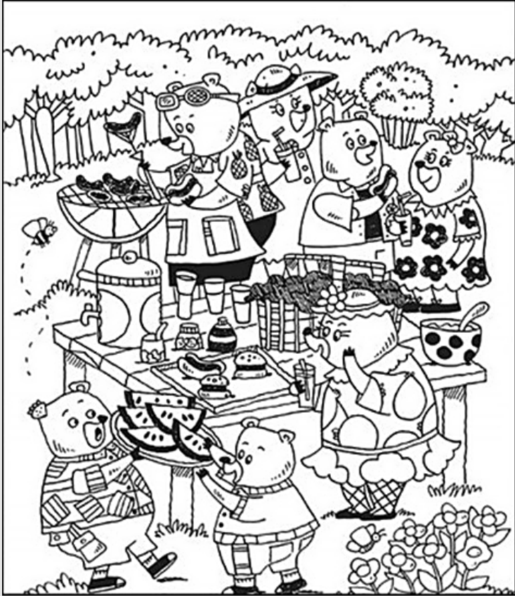
© 위의 그림에 숨어있는 아래 그림을 찾으려 영어 단어도 익혀 보세요. (해답은 P45에 있습니다.)