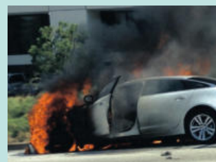
차량 화재 Car Fires