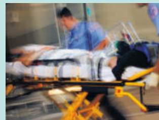
심각한 부상 Serious Injuries