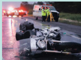
오토바이 사고 Motorcycle Accidents