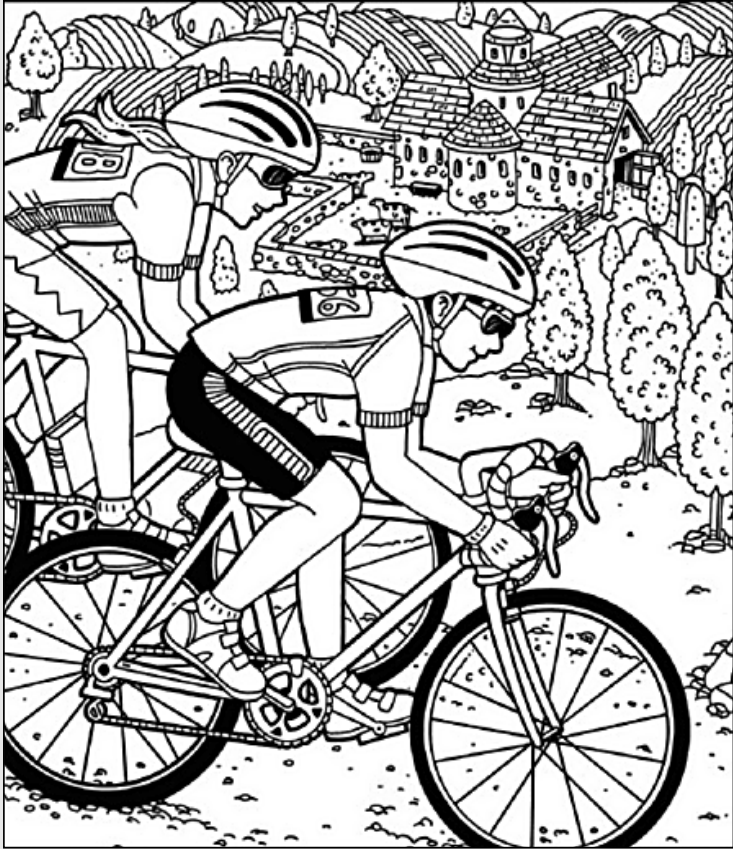
© 위의 그림에 숨어있는 아래 그림을 찾으려 영어 단어도 익혀 보세요. (해답은 P45에 있습니다.)