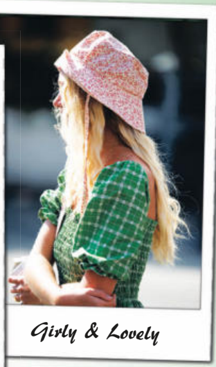
Girly & Lovely

스케이트보드? 힙합? 벙커지? 버킷햇(Bucket Hat)에 대한 선입견은 버리자. 원피스와 슈트에도 어울리는 미친 소화력, 버킷햇의 전성기는 바로 지금이다!