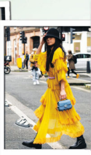
Put a Hat On