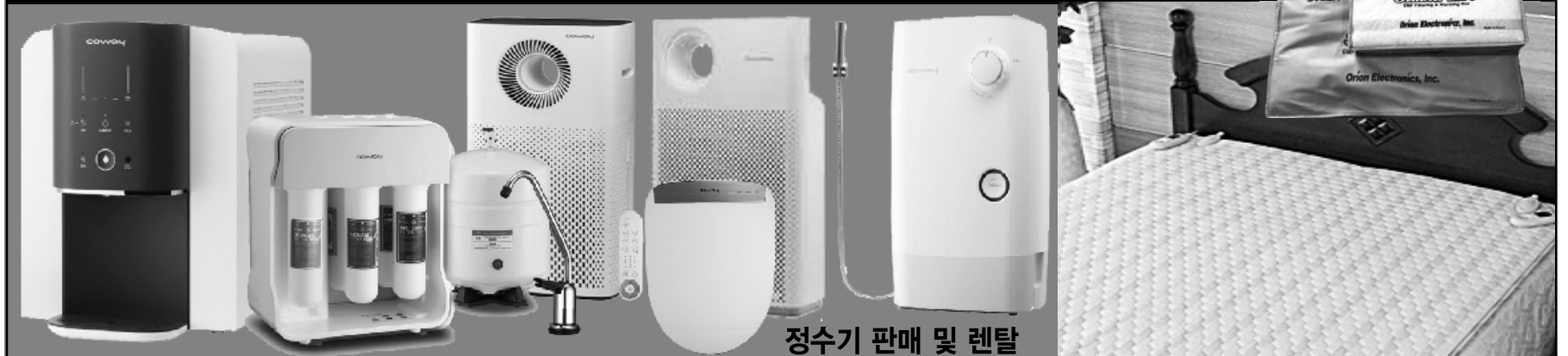
정수기 판매 및 렌탈

714.523.9588 / 714.471.1843 5301 Beach Blvd, Buena Park, CA 90621 한남체인 내