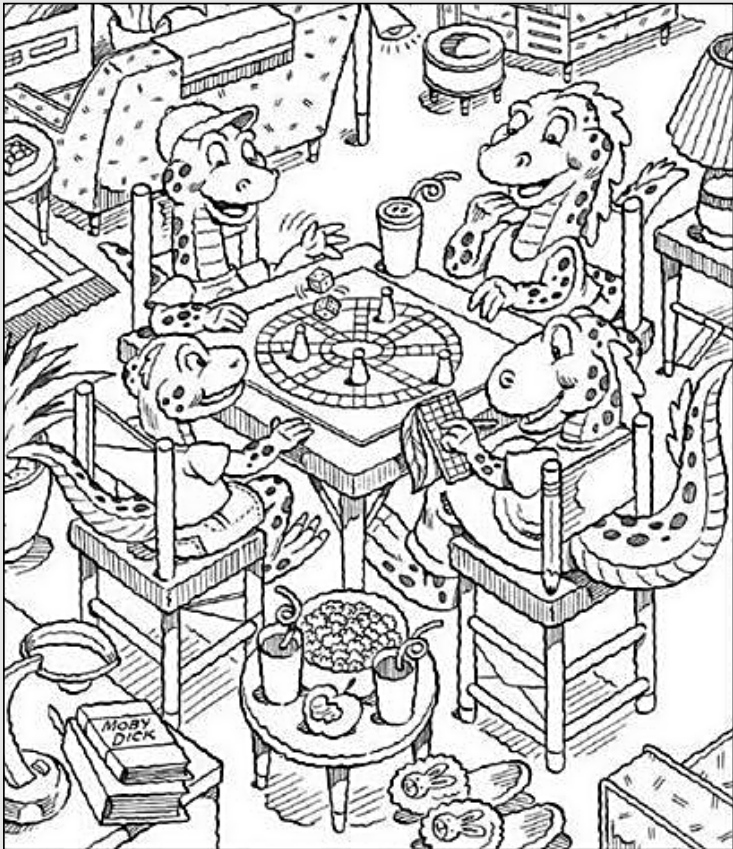
© 위의 그림에 숨어있는 아래 그림을 찾으며 영어 단어도 익혀 보세요. (해답은 P45에 있습니다.)