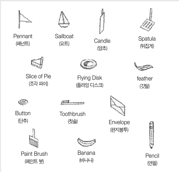
■이미지 출처: Highlights.com