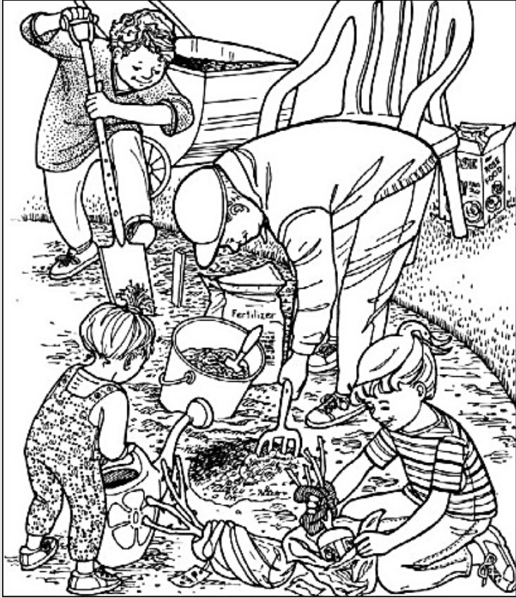
© 위의 그림에 숨어있는 아래 그림을 찾으며 영어 단어도 익혀 보세요. (해답은 P46에 있습니다.)