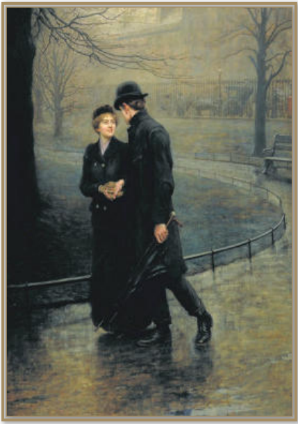
에덴 동산 (The Garden of Edenc, 1901)

휴 골드윈 리비에 (Hugh Goldwin Reviere 1869 - 1956)