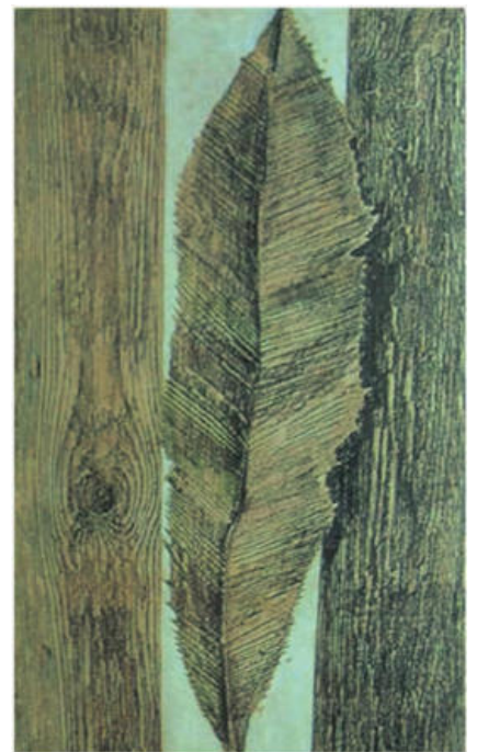
▲ 막스 에른스트의 프로타주 '일사귀의 버릇'