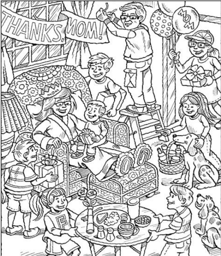
© 위의 그림에 숨어있는 아래 그림을 찾으며 영어 단어도 익혀 보세요. (해답은 P51에 있습니다.)