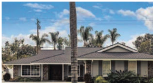
플러톤 단층 단독주택 918천불 방 3 화 2 1936 sqft 대지 8833sqft

롤링 힐스 스쿨과 크레이그 파크...2층 - 5 베드룸 플러스 패밀리 룸, 2-1/2 욕실, 2,442 Sq. Ft, 2,419 Sq.ft, RV parking, 충분한 뒷마당공간