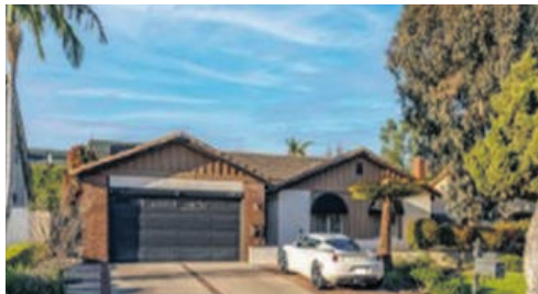
플러톤 단층집 869천 방 3 화 2개 1658sqft 대지 9500sqft

Founders Walk위치!! 1층에 방과 욕실, 2층에는 아주 넓고 세련된 주방과 거실, 집안 전체마루, 3층에는 침실 2개와 세탁실, 각 방마다 화장실, 마켓에 오래있지 않을 매물