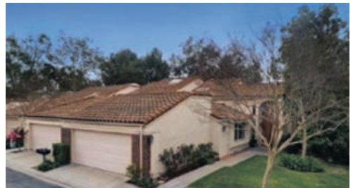
플러톤 타운홈 725천불 2077sqft 방 3개 화 2개 (아직 마켓에 안나온집)

많은 과일 나무들을 포함한 많은 최근의 업그레이드들, 모든 침실에는 천장 선풍, 유지 보수도 쉽고 적은 아늑한 뒤뜰, 훌륭한 학교, 이웃