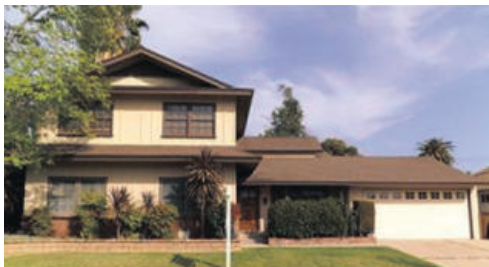
플러톤 단독주택 859천불 2442 sqft 방 5개 화 2.5 개 대지 7519 sqft

24시간 안전한 게이트 커뮤니티 페어웨이 빌리지!! 웅장한 거실과, 웅장한 천장, 벽난로, 무성하고 사적인 공동 구역의 인상적인 경치, 초대형 마스터 스위트룸과 전용 발코니, 1층에 침실 2개와 리모델된 욕실, 플러톤의 중심부 위치,