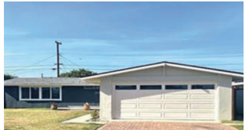
부에나파크 싱글 패밀리단독 주택 675천 방3개 화 2개 1483 sqft 대지 6000sqft

메도우브룩 커뮤니티4베드 2.5 욕실, 1800SQFT 탁 트인 천장과 아늑한 벽난로, 리모델된 키친, 아래층 욕실,새로운 타일 지붕, 로스 코요테스 컨트리 클럽