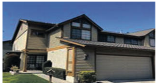
플러톤 타운홈 659천 방 3개 화 2.5개 1444 sqft

플러톤 최고의 학군 넓고 햇볕이 잘 드는 집, 오픈 패밀리 룸, 대형 거실, 디자이너 조명, 천장 팬 및 크라운 몰딩 전체, 멋진 파티오,라구나 호수 근처, 차고 위쪽에 커다란 다락방, 전기 자동차 충전 가능.