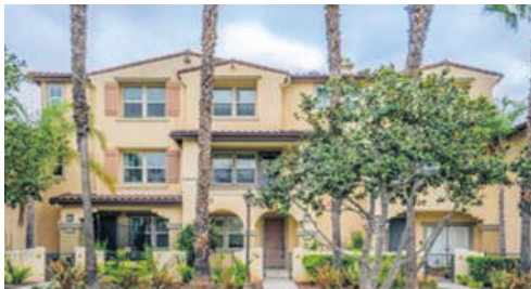
부에나파크 콘도 타운홈 66만불 2006년 방 2개 화 3 1/2 1632 sqft

단층집, 탁 트인 구조, 아늑한거실, 리모델된 욕실, 보너스룸,새페인트, 새 지붕, 새 히터, 루터 초등학교, 워커 JHS, 케네디 HS,최고의 옥스퍼드 하이, 사이프레스 대학 도보거리