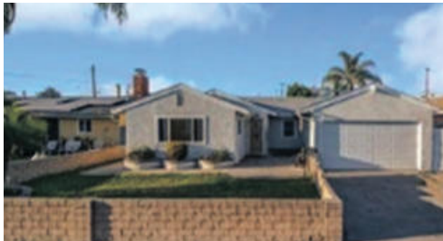
부에나파크 찾기 힘든 단층 아직 마켓에 안나온 단독주택 699천

주택, 상가, 사업체 투자매물 무엇이든 맡겨 주십시오. 여러분의 집을 일주일안에 최고의 가격으로 매매 성사 시켜 드립니다