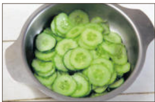
1. 오이는 송송 썰어 큰 볼에 넣고 굵은 소금을 전체적으로 솔솔 뿌려 10-20분간 절인다.