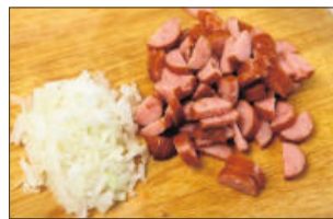
3. 프랑크소시지는 반으로 길이대로 잘라 얇게 송송 썰고, 양파는 잘게 다진다.