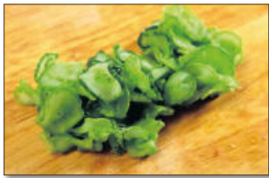
4. 충분히 절여진 오이는 물기없이 국물을 꼭 낸다.