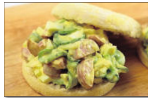
6. 반으로 가른 맥머핀빵에 햄달걀오이 샐러드를 넣어주면 끝.