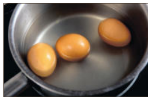
2. 달걀은 찬물에 넣고 끓기 시작해서 약 10분 정도 더 삶아 완숙으로 익혀, 찬물에 넣고 충분히 식힌 후 껍질을 벗긴다.