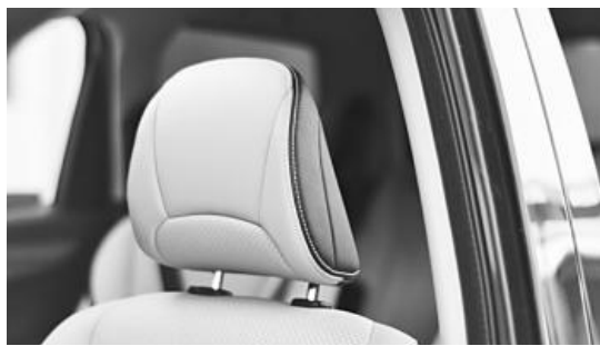
▲ 헤드 레스트.