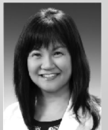
Dr. 백사론 한의원, 척추신경의사 SCU 척추 의대 졸업 South Baylo 한의대 졸업

9681 Garden Grove Bl., Suite 101 Garden Grove, CA 92844(모란각 식당 옆)