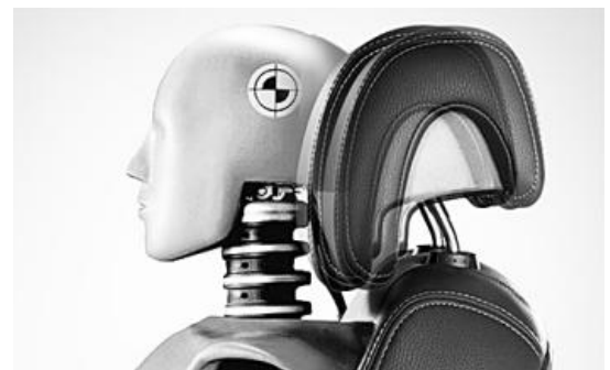
▲ 액티브 헤드 레스트.

이에 따라 액티브 헤드 레스트는 앞으로 더 많은 차량에 보급될 것으로 예상된다.