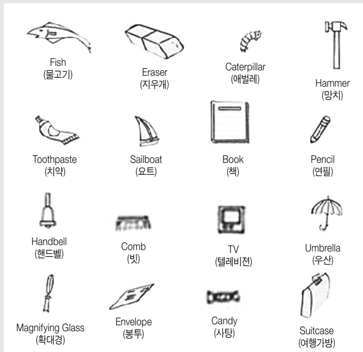
■이미지 출처: mungfali.com