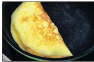
5. 달걀이 완전하게 익기 전에 반으로 포개 주면 달걀 오믈렛은 완성!!