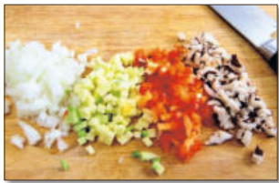
1. 집에 있는 자투리 채소들을 다져서 1컵 정도 준비한다. (채소와 함께 햄이나 베이컨을 다져서 넣어도 좋습니다.)

◆ 주재료: 달걀(3개), 소금(적당량), 식용유(1), 스위트칠리소스(적당량), 베이비 채소(적당량) ◆ 채소 볶음 재료: 다진 채소(1컵), 마요네즈(1), 토마토소스(2), 모짜렐라 치즈(3분의 1컵), 소금, 후춧가루(적당량)