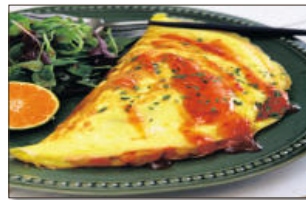
6. 완성 그릇에 달걀오믈렛을 담고, 그 위에 스위트칠리소스를 뿌려주면 끝.