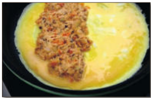
4. 달군 팬에 식용유가 충분히 달구어지면 달걀 쫄 것을 모두 넣어 전체적으로 펼치고, 달걀 윗면이 반쯤 익으면 미리 볶아놓은 채소치즈 볶음을 한쪽으로 길게 올린다.