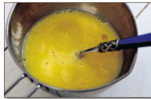
3. 달걀은 소금을 넣고 잘 풀어준다. (이때 조금은 부드럽게 먹고 싶으면 우유(2-3)를 함께 넣어 주어도 좋아요.)