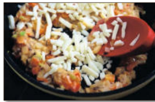
2. 달군 팬에 기름을 살짝 두르고, 다진 채소를 달달 볶다가 마요네즈, 토마토소스를 넣고 볶고, 마지막에 모짜렐라 치즈, 후춧가루를 넣고 치즈가 살짝 녹을 때까지 볶아 잠시 식혀준다.