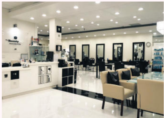
▲ 사진=The Beauty Box

사람의 외모를 좌우하는 패션, 메이크업, 헤어스타일 가운데 헤어스타일이 사람의 뇌리에 가장 강한 인상을 준다는 연구 결과도 있다. 첫인상과 헤어스타일의 상관관계를 연구한 예일대학교 여성학 교수이자 심리학자인 마리안 라프랑스 교수팀의 연구결과이다. 라프랑스 교수팀의 연구결과는 첫 인상의 60% 이상은 외모로 결정되고 그 가운데 50% 이상은 얼굴에 달려 있으며, 얼굴에서는 헤어스타일이 50% 이상을 차지하고 있다고 전하고 있다.