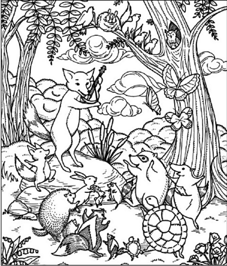
© 위의 그림에 숨어있는 아래 그림을 찾으며 영어 단어도 익혀 보세요. (해답은 P45에 있습니다.)