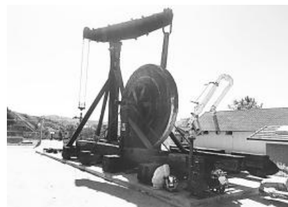
▲ Olinda Oil Trail, 노란 유채꽃이 한창이다(왼쪽), 오일을 채취하던 기계.

우리들은 봄이 되면 멀리 꽃놀이를 가야 하는 줄 알고 있다. 굳이 멀리 가지 않고 우리가 사는 동네 근처에도 훌륭한 꽃놀이 장소가 있다. 이 트레일은 Olinda Oil Trail이라는 이름에서 알 수 있듯이 유정(油井)이 있는 곳으로 아직도 펌핑을 하는 곳도 있다.