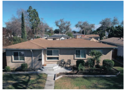
풀러톤 단층집 70만불 방4 화3 1,428sqft cul-de-sac 보시면 반하실 너무 예쁜 집. 대지 6,600sqft 최신 업그레이드/리모델링 풀러톤 최고 초중고 학군