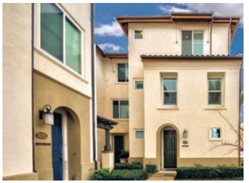
부에나팍 타운홈 699천 방3 화3 1,652sqft 2016년 지은 깔끔하고 안전한 단지 안에 있는 편리한 교통, 3car garage, Fullerton high 학군