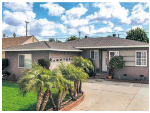
풀러톤 단층집 65만불 방3 화2 13,00sqft 인기매물 아주 예쁘고 마당--땅 아주 넓은 잘 관리된 집 포탠셜 많은 싱글홈 대지 6,200sqft, Turn key