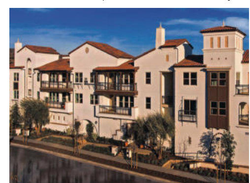
브레아 55+ 시니어 단지 분양 단층 구조 $600,000부터 55+ Age 2021년 완공 1.389 to 1.726sqft 방2-3개부터 + Den 화2