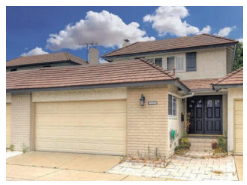
부에나팍 싱글 홈 695천 방3 화3 1,600sqft 집전체 마루, 최신식 리모델링, 업그레이드 마친집 써니힐스 고등학교, meadow brook community