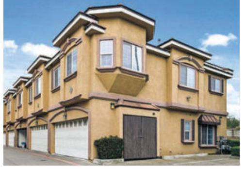
가격 착한 부에나팍 타운홈 495천 방3 화3 1,200sqft 2006년 투자라도 너무 좋은 살기 편리한 주위 환경 한인 상권 가까운곳 위치 풀러톤학군