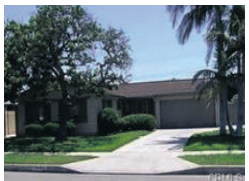
부에나팍 싱글홈 689천 방3 화2 1,100sqft 대지 7,000saft 큰 보너스 룸, 오피스룸 초등학교 도보거리, 인기매물 포텐셜 있는 집