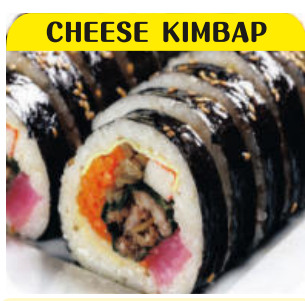
치즈 김밥 $8.00+Tax