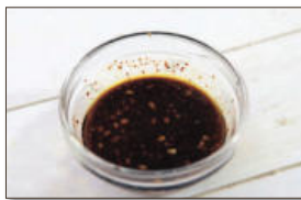
3. 양념재료인 고춧가루, 다진 마늘, 맛술, 양조간장, 올리브오일, 참기름을 한데 넣어 잘 섞는다.