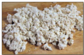
1. 두부는 부침용으로 준비해 물기를 키 천타월에 살짝 빼고, 칼로 대충 으갠다.