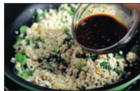
5. 이어서 미리 만들어 놓은 소보로와 양념장을 붓고 전체적으로 양념이 잘 배도록 볶는다.