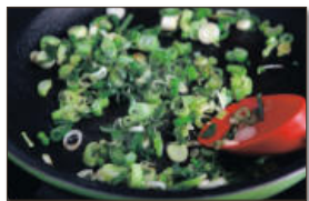
4. 대파는 송송 썰어 달군 팬에 식용유를 두른 후 달달 볶는다.