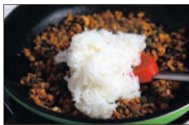
6. 밥을 넣고 밥과 재료가 고루 잘 섞이도록 1-2분간 볶다가, 마지막으로 통깨를 넣고 고루 섞어주면 끝.