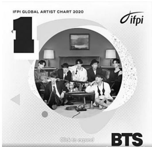
▲ 영IFPI 선정 올해의 글로벌 아티스트상을 받은 방탄소년단.

방탄소년단(BTS)이 국제음반산업협회(IFPI)가 수여하는 올해의 글로벌 레코딩 아티스트상을 수상했다.