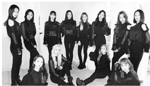
▲ 이달의 소녀.

결그룹 이달의 소녀(LOONA)가 영어 곡 '스타' (Star)로 미국 주요 라디오 차트에서 상승세를 이어가고 있다.