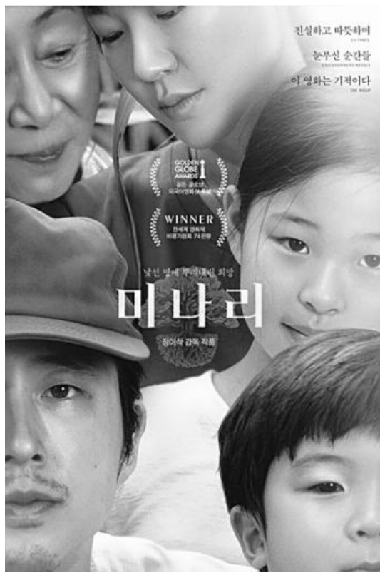
▲ 영화 '미나리' 포스터.