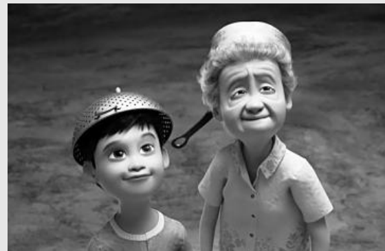
▲ 단편 애니메이션 '윈드'.

'애니메이션의 명가' 픽사가 한국 할머니의 희생과 사랑을 그린 단편 애니메이션 '윈드' (Wind, 감독 에드윈 장)를 무료로 공개했다.