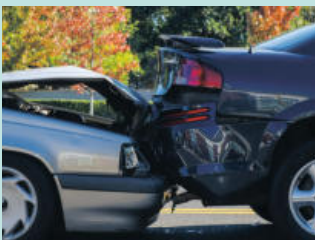
교통 사고 Auto Accidents