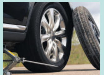
타이어 결함 Defective Tires