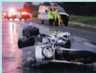
오토바이 사고 Motorcycle Accidents