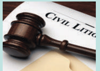
민사 소송 Civil Litigation