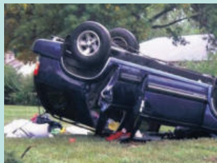
지붕파손 / 차량전복 Roof Crush / Roll Overs