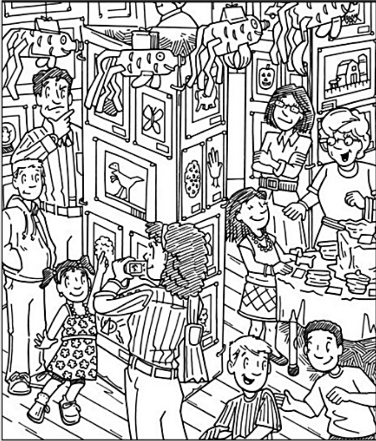
© 위의 그림에 숨어있는 아래 그림을 찾으며 영어 단어도 익혀 보세요. (해답은 P45에 있습니다.)