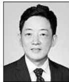
매주 첫째주 월요일 라디오 코리아 이민상담 진행

● LA Office: (213) 232-1655 ● OC Office: (714) 522-5220