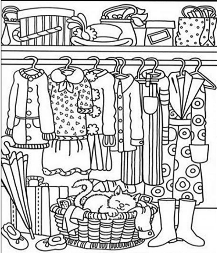
© 위의 그림에 숨어있는 아래 그림을 찾으며 영어 단어도 익혀 보세요. (해답은 P45에 있습니다.)