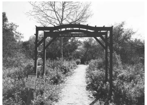
▲ 공원 안의 또 다른 공원 Nature Area

단순히 걷기 위한 목적으로 공원 안에 주차하려면 Edinger Ave.에서 들어가거나 Euclid St.에서 들어가야 한다. 공원 안에 주차하려면 평일 3달러, 휴일 5달러를 내야하기 때문에 공원 밖의 거리에 주차하는 사람들이 꽤 많은 편이다. 필자는 지난 주 월요일 점심 시