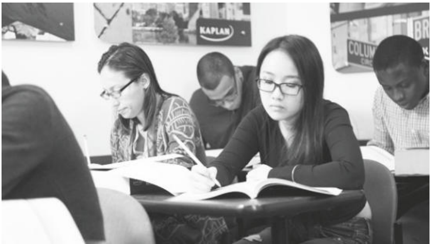
▲ 독서는 자기주도적 학습능력을 향상시킨다.

앞서 설명을 했듯이 글은 단번에 끝낼 수 없다. 수없이 고치는 과정을 반복해야 한다. 여기서 문법의 오류나 철자법을 틀리는 것은 치명적이다. 내용의 수정도 거듭해야 한다. 처음에 쓴 내용이 하나도 남지 않을 정도로 수정에 수정을 가해야 한다. 전문작가나 글쓰기 전문가도 수없이 고치는데 하물며 비전문가인 학생들은 말할 나위가 없다. 교열은 많이 보면 볼수록 좋다. 여러 번 읽다 보면 매끄럽지 못한 부분들이 눈에 띄게 된다. 교사나 친구, 부모에게 보여주는 것도 좋은 방법이다. 내가 보지 못한 실수를 발견할 수 있다.