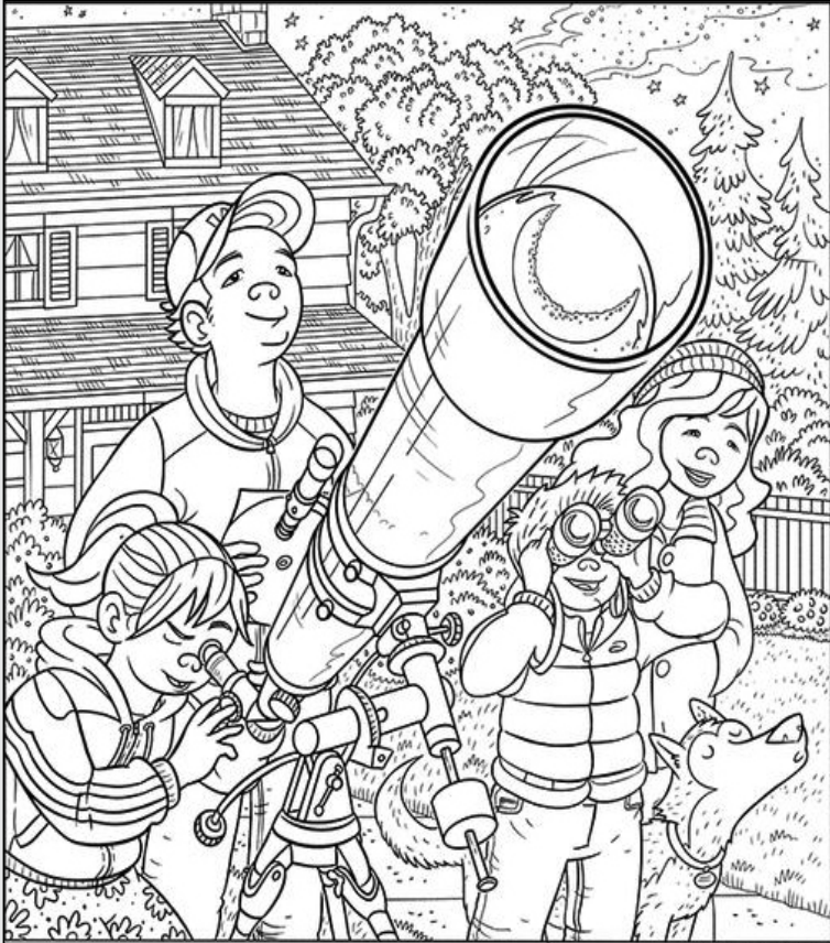
© 위의 그림에 숨어있는 아래 그림을 찾으며 영어 단어도 익혀 보세요. (해답은 P45에 있습니다.)