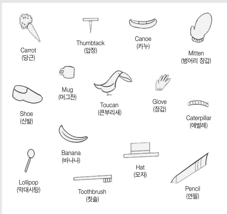
■ 이미지 출처: www.pinterest.co.kr