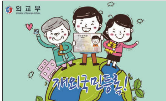
▲ 그래픽=한국 외교부

국내거소신고시에는 비치된 양식에 따라 신고서를 작성하여야 하며, 재외국민의 경우 ① 거주국의 영주권사