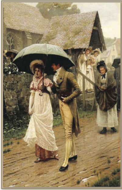
비에 젖은 어느 일요일 아침 (A Wet Sunday Morning c. 1896)

에드먼드 블레어 레이튼 (Edmund Blair Leighton 1852 - 1922) (캔버스에 유채)