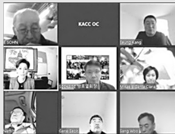
▲ 영 김 연방하원의원 초청 화상간담회에서 참석자들이 의견을 나누고 있다.

이날 간담회에서 김 의원은 회원들의 질의에 ● 연방 최저임금 15달러 인상 반대 ● 롱비치항구 정상화 위해 항구 운영자들 백신 접종 우선 접종을 주지사에게 요구 ● PPP규정 완화를 통해 많은 소상공인들에게 혜택이 돌아갈 수 있도록 논의 ● 소상공인 세금 감면 방안 모색 등의 답변을 전하며 소상공인들을 위한 정책 마련에 앞장서겠다고 다짐했다.