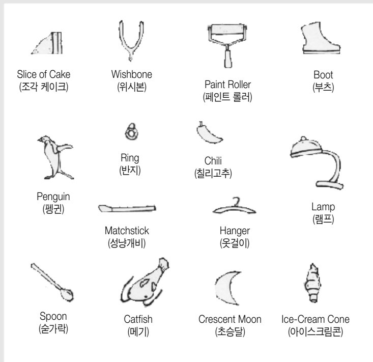
■ 이미지 출처: www.pinterest.co.kr