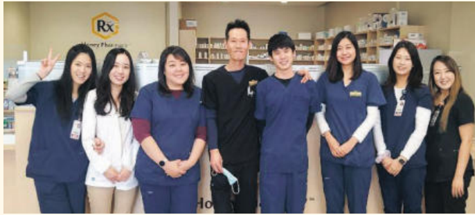
▲ 몸과 마음의 건강을 선사하는 '꿀약국' 스텝들.

예로부터 전염병이 창궐하는 시대의 약국은 약재로도 병을 치료하였으나 마음의 치료를 중시 여겨왔다. 조선 시대 혜민서의 의료진들은 마음으로 환자들과 동고동락하였고, 백성들의 마음을 위로하고, 군량미를 풀어서까지 백성들을 배불이 먹임으로 해서 예방의학에 힘써왔던 것이 우리 선조들의 지혜였다. 라팔마에도 이러한 진심으로 환자들을 돌보고 사랑을 함께 나누는 “꿀” 약국이 있다.