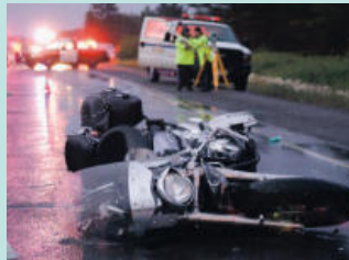
오토바이 사고 Motorcycle Accidents