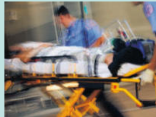
심각한 부상 Serious Injuries