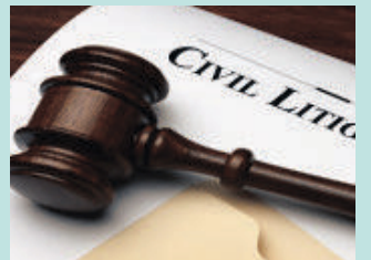
민사 소송 Civil Litigation