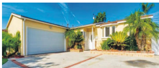
플러튼 단층집 방4 화2 대지 6,500sqft 57만 5천불