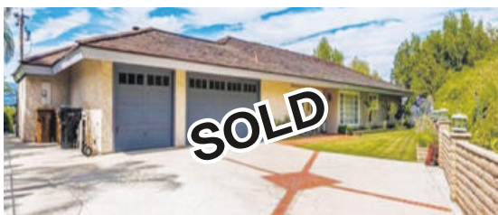
플러튼 단층집 114만불

주택, 상가, 사업체 투자매물 무엇이든 맡겨 주십시오 아이비가 하면 틀림없습니다!