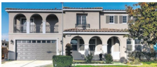
이스트베일 럭셔리 하우스 방 5 화5 77만 4천불