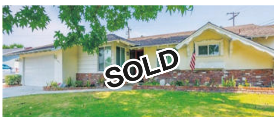
라하브라 단층집 78만 9천불