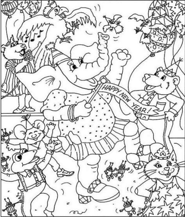
© 위의 그림에 숨어있는 아래 그림을 찾으며 영어 단어도 익혀 보세요. (해답은 P45에 있습니다.)