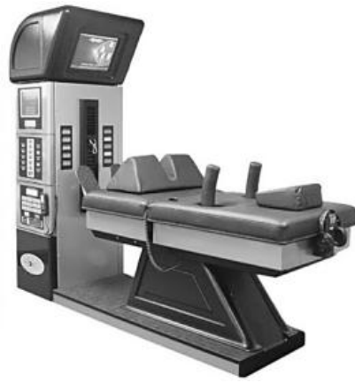
▲ 최첨단 무중력 감압 치료기 DRX-9000

<조이척추신경병원>은 촬영과 동시에 판독을 할 수 있어 진단의 시간을 단축하며 정확하고 세밀한 판단을