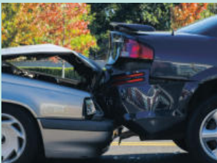
교통 사고 Auto Accidents