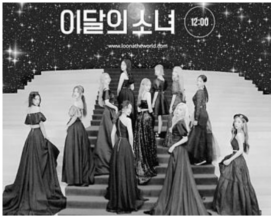
▲ 걸그룹 '이달의 소녀'.

걸그룹 '이달의 소녀'가 데뷔 후 처음으로 미국 빌보드 메인 앨범 차트에 진입했다.