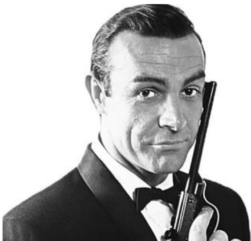
▲ 007 위기일발(From Russia with Love, 1963)에 출연했을 당시의 손 코너리.

영화 '007' 시리즈에서 처음으로 제임스 본드 역할을 연기한 스코틀랜드의 원로 배우 손 코너리가 지난 31일 타계했다. 향년 90세.