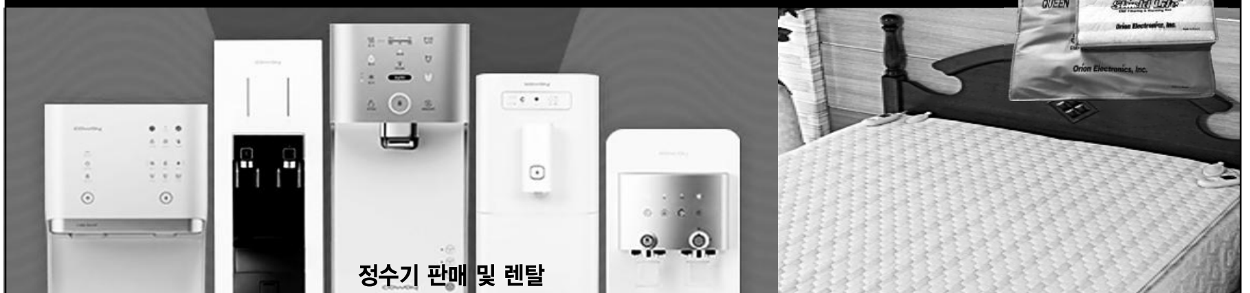
정수기 판매 및 렌탈

714.523.9588 / 714.471.1843 5301 Beach Blvd, Buena Park, CA 90621 한남체인 내