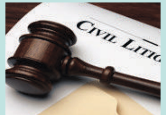
민사 소송 Civil Litigation